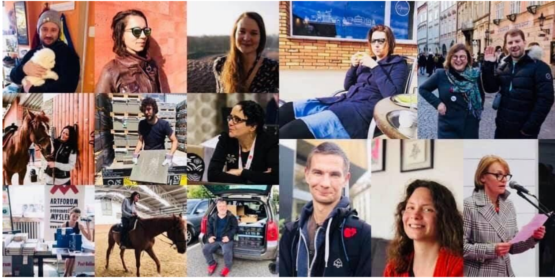
Post Bellum SK collective ☺